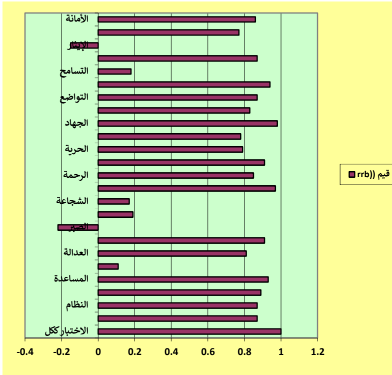
شكل (2) قيم معامل الارتباط الثنائي للرتب ( r_{rb} ) بالنسبة للقيم الاجتماعية.

- تفسير النتائج المتعلقة بفرض البحث، والسؤال الرابع من أسئلته: