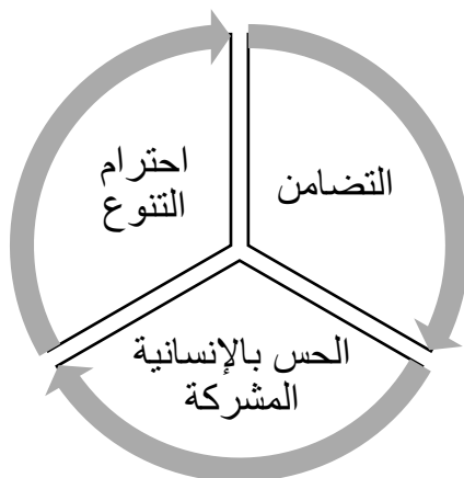
شكل رقم (١) المفاهيم الأساسية الثلاثة للتربية على المواطنة العالمية (اليونسكو، ٢٠٢٢، ص. ٢)

ونستطيع أن نجمل المفاهيم الأساسية الثلاثة للتربية على المواطنة العالمية بالشكل التالي: