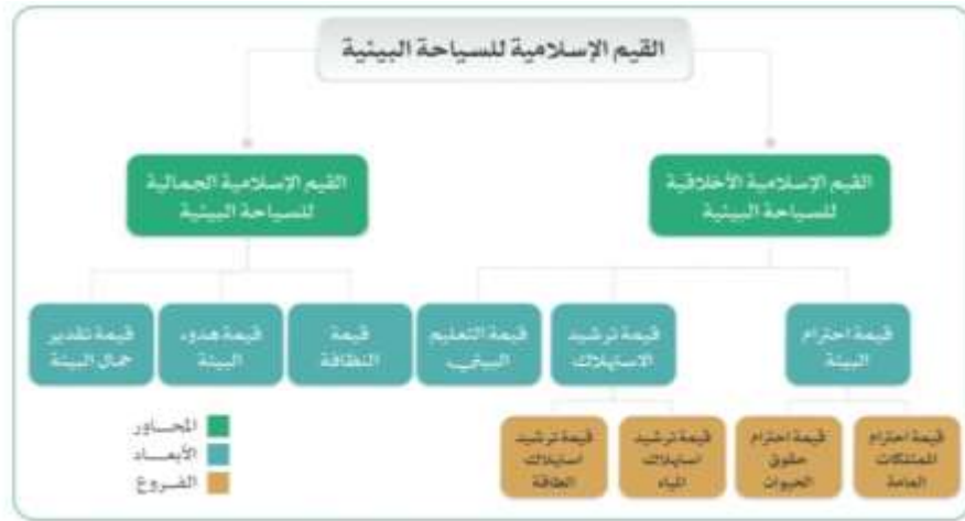
الشكل (١) القيم الإسلامية للسياحة البيئية (الباحثتان)

تناولت الدراسة الحالية المتغيرات التالية لبناء العلاقة الارتباطية حيث تمثل المتغير المستقل في دور معلمة المرحلة المتوسطة في إكساب الطالبات القيم الإسلامية للسياحة البيئية، ويشمل ذلك على محورين وكل محور على ثلاثة أبعاد وهي كالتالي: المحور الأول: القيم الأخلاقية الإسلامية للسياحة البيئية ويتضمن ثلاثة أبعاد ولكل بُعد فروع وهي كالتالي: البعد الأول: احترام البيئة ويشمل على فرعين: الفرع الأول: احترام الممتلكات العامة، الفرع الثاني: احترام حقوق الحيوان، البعد الثاني: ترشيد الاستهلاك ويشمل على فرعين: الفرع الأول: ترشيد استهلاك المياه، الفرع الثاني: ترشيد استهلاك الطاقة، البعد الثالث: التعليم البيئي. المحور الثاني: القيم الإسلامية الجمالية للسياحة البيئية ويتضمن على ثلاثة أبعاد البعد الأول: النظافة، البعد الثاني: هوء البيئة، البعد الثالث: تقدير جمال البيئة وتوضح الباحثتان في الشكل (١) القيم الإسلامية للسياحة البيئية.